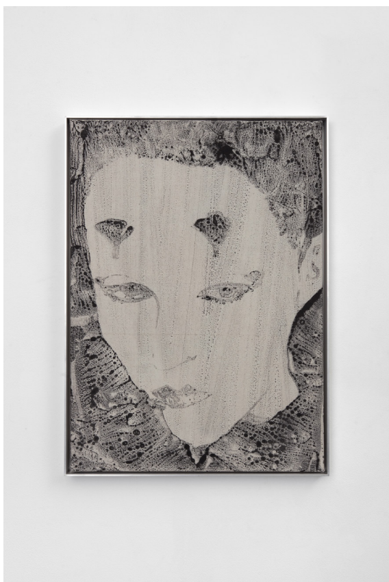
David Noonan, 2023, Singe V.II, Liquid pigment on hand-dyed fabric, Aluminium Frame, 57.5 x 42 x 4 cm

CHARLES AVERY SHIORI EDA LOUIS LE KIM TURIYA MAGADLELA DAVID NOONAN BAO VUONG