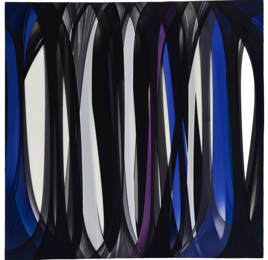
Turiya Magadlela, Is it true? To say that all black lives, of both the rich and poor people, are important?(panel 3), 2019, Nylon and Cotton Pantyhose on canvas, 120 x 120 cm

The artists gathered in this exhibition share, to varying degrees, a certain darkness: the feeling of evolving in an endless world (Bao Vuong, Louis Le Kim), leading to a tension or a tightening of space (Turiya Magadlela, Shiori Eda), to the construction of an imaginary universe (Charles Avery) or a purely theatrical and «played» one (David Noonan).