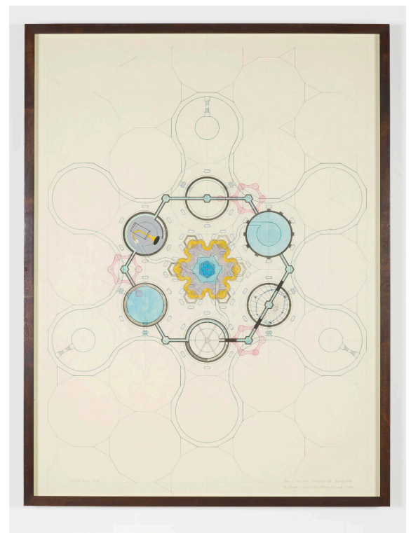
Charles Avery, Untitled (Plan of Inner Circle, Onomatopeia Zoo) , 2017, Ink, pencil, watercolor and acrylic on parchment mounted to board, 119 x 88.8 cm