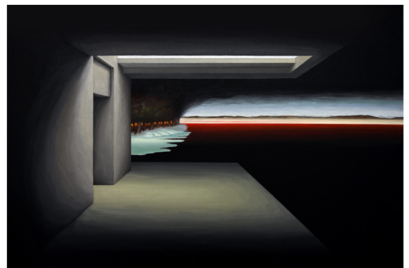
Louis Le Kim, Sans titre, 2022, huile sur toile, 120 x 180 cm

RADICANTS est une coopérative curatoriale, internationale et nomade, fondée par Nicolas Bourriaud en 2022. Parmi ses nombreuses activités auprès des institutions publiques et privées, fondations et collections, RADICANTS accompagne la programmation de galeries à travers le conseil, le commissariat d'expositions collectives, des propositions d'artistes et de rétrospectives.